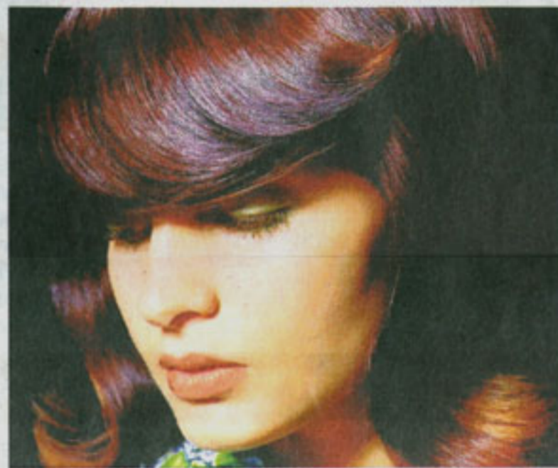
Im Herbst und Winter geht der Trend zu mehr Weiblichkeit: Weiche Wellen schenken Eleganz und Glamour.