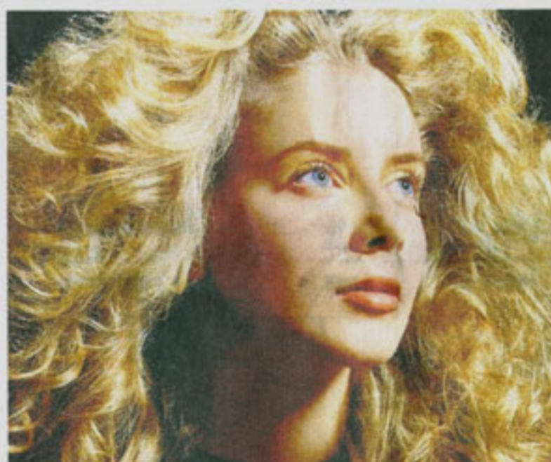
Voluminöse Frisuren, die der „Denver-Clan“ schon einmal in Mode brachte, kommen als „ Big Hair “-Look wieder.