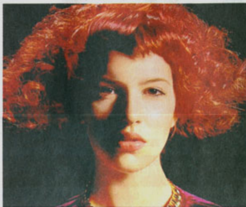
Nichts für Zierliche: Die Lockenpracht mit glattem Pony (hier in der Trendfarbe Rot) verlangt harmonische Konturen.