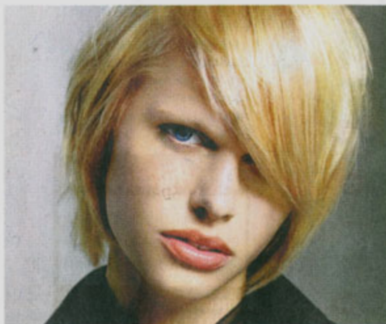
Der androgyn Look bleibt auch im Herbst und Winter: Die Kurzfrisur mit schrägem Pony steht Männern wie Frauen.

Um die richtige Frisur zu finden, sollte der Friseur genau hinschauen: „Ich muss sehen, welchen Teint die Kundin hat, um beurteilen zu können, welche Haarfarben ihr stehen. Auch die Augenfarbe ist wichtig und die Haarstruktur. Zudem muss man schauen, wie die Gesichtsfarbe beschaffen ist“, so Decker. Ein schmales Gesicht wirkt mit langen Haaren noch länger, eine Lockenpracht auf einem kleinen Kopf erdrückend. Bei einer kur-