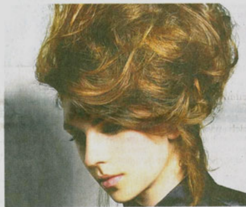
Eine aufwändige Abendfrisur für Romantikerinnen , ganz à la Bohème.

zen Stirn sei von einem langen Pony abzuraten, sagt der Experte.